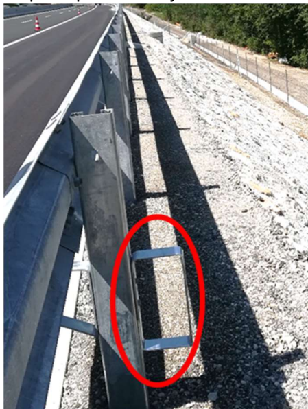
Slika 2: Stopa za prehod čez jekleno varnostno ograjo

pločevine min. debeline 5 mm in širine 55 mm in na steber ograje pritrjen z dvema vijakoma M10x30 s šestrobo glavo. Matica in podložka morata biti pritrjeni z notranje strani stebra varnostne ograje. Mesto, na katerem je pločevina varjena, mora biti ob stebru varnostne ograje. Elementi za prehod čez varnostno ograjo (stopa, slika 2) se nameščajo pri vsakem odsevniku. V primeru, da prehod s stopo ni mogoč, se namesti lestev za prehod preko JVO, skladno z odstavkom b).