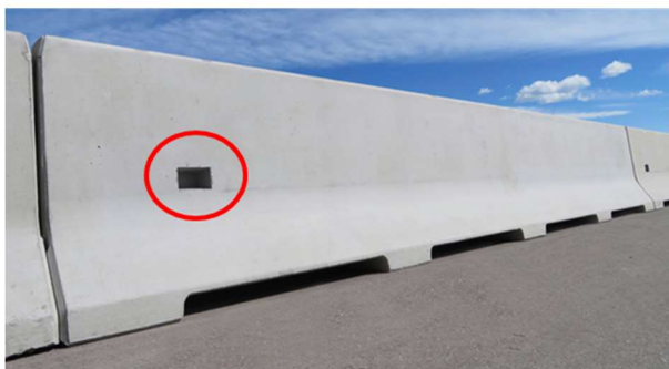
Slika 1: (levo), 1a (desno): Stopnica (utor) za lažji prehod čez ograjo